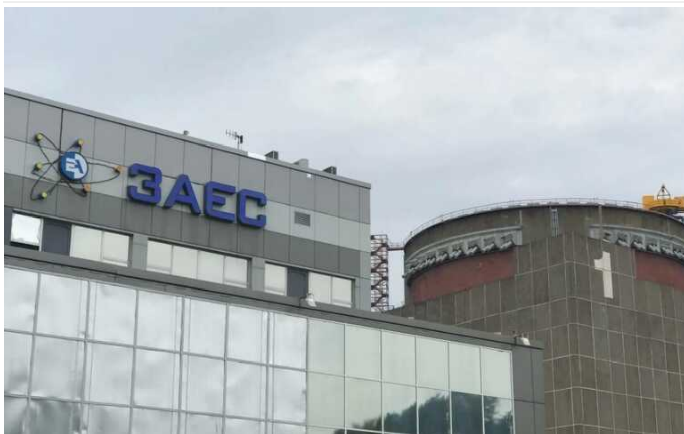
ЗАЕС втратила зв'язок із останньою резервною зовнішньою лінією електропередачі, - МАГАТЕ

Наразі станція отримує електроенергію від єдиної лінії 750 кВ, "що ще раз наголошує на крихкій ситуації з ядерною безпекою на об'єкті".