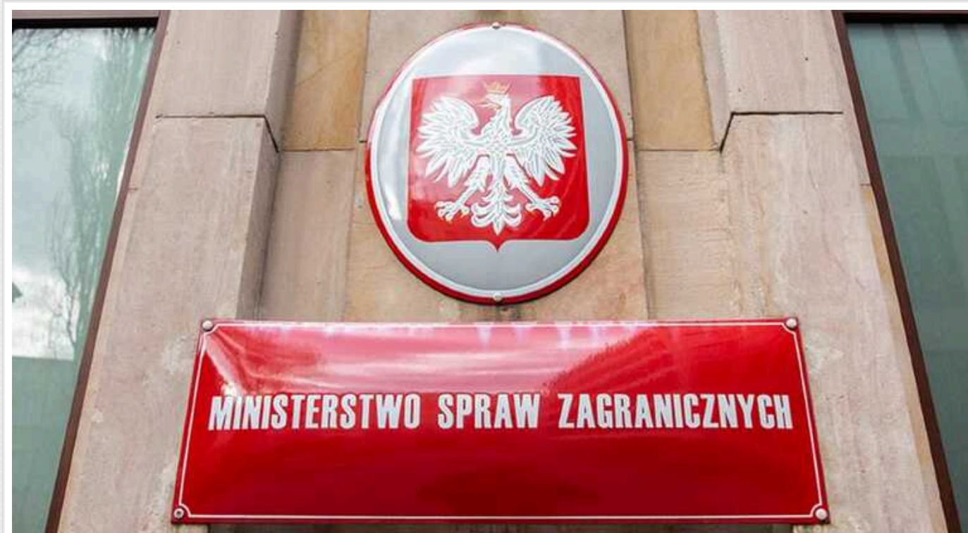
У МЗС Польщі заявили про можливе впровадження агентів РФ до лав протестуючих польських фермерів