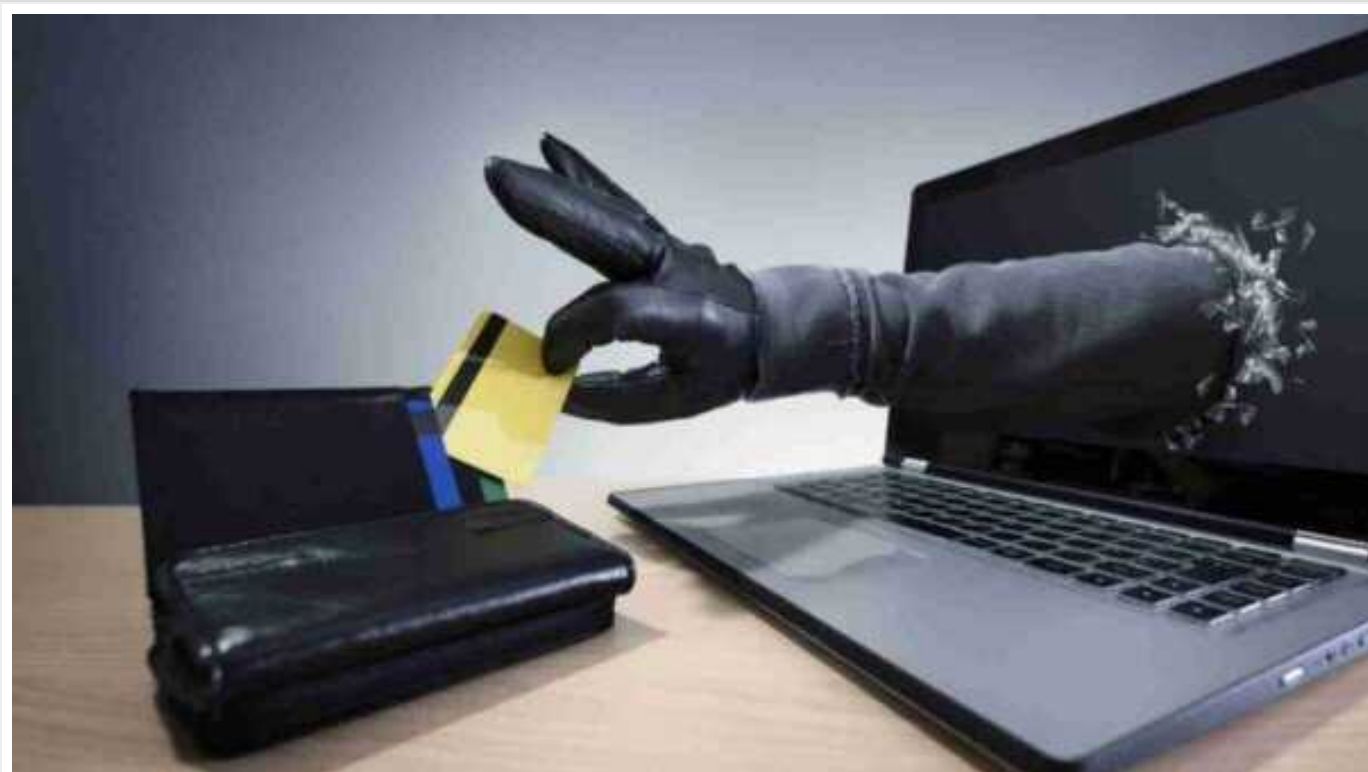
Кількість нових справ про шахрайство за минулий рік сягнула максимуму за останні 11 років

Упродовж 2023 року в Україні було відкрито 82,6 тис. кримінальних проваджень за звинуваченнями у шахрайстві (ст. 190 ККУ). Це у 2,6 раза більше, ніж у 2022 році та найвищий показник за останніх 11 років.