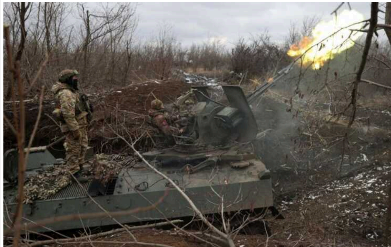
Пентагон не зміг заздалегідь підготувати "адекватні плани" підтримки озброєння, переданого Україні, - Bloomberg