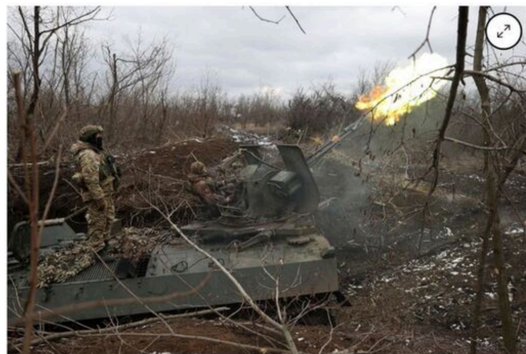
The Pentagon focuses considerable attention on the sustainment of weapons systems, which often amount to more than 70% of program costs.