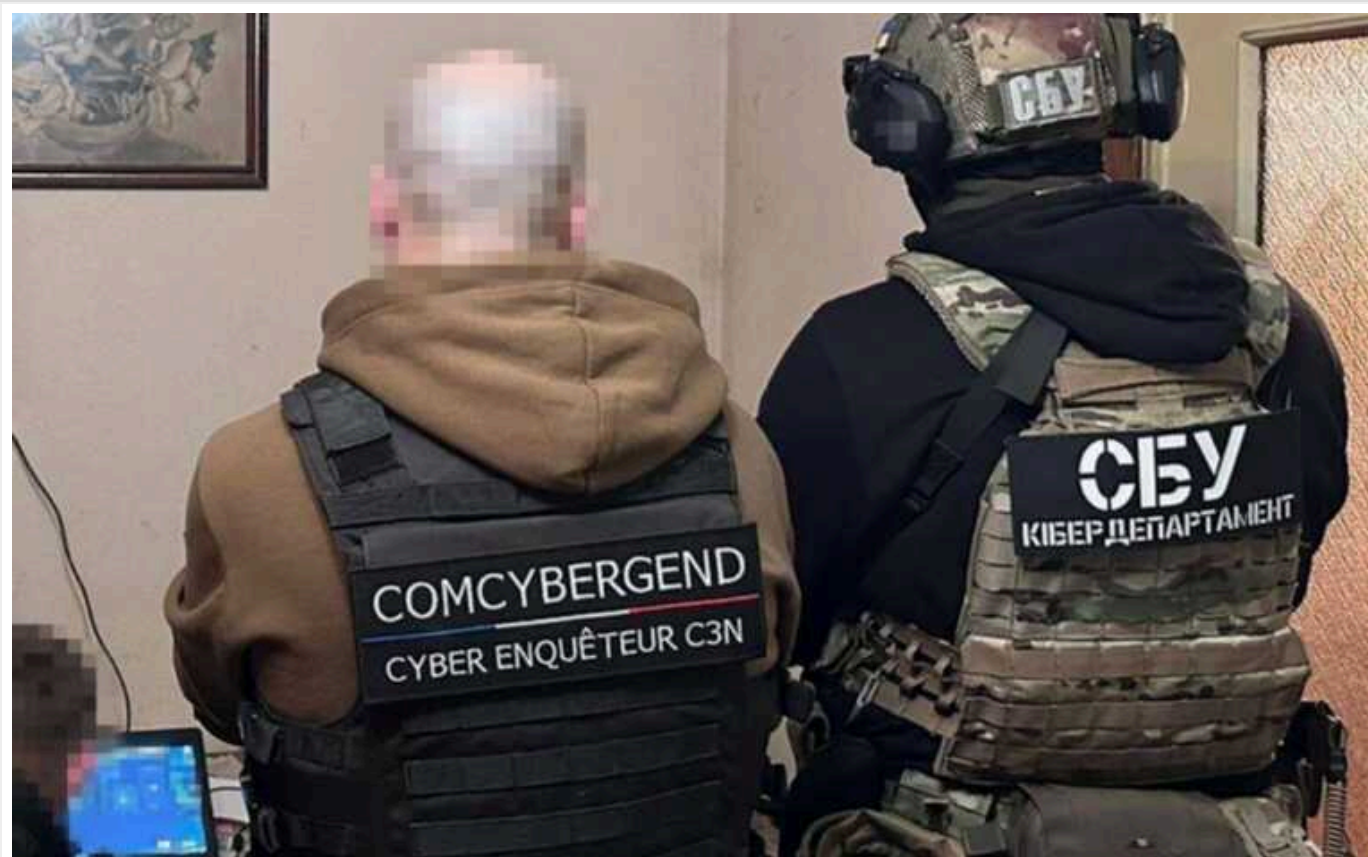
СБУ спільно з правоохоронцями США, Великої Британії та ЄС викрила міжнародне угруповання хакерів-вимагачів

Кіберфахівці Служби безпеки спільно з правоохоронними органами США, Великої Британії, Євросоюзу та інших країн-партнерів провели масштабну спецоперацію у різних частинах світу.