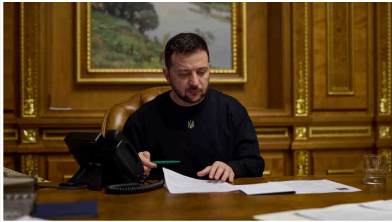
Президент Зеленський провів селектор: обговорювалося гостре питання блокування на польському кордоні

Володимир Зеленський розповів, що Україна визначила свої наступні кроки щодо ситуації на кордоні з Польщею.