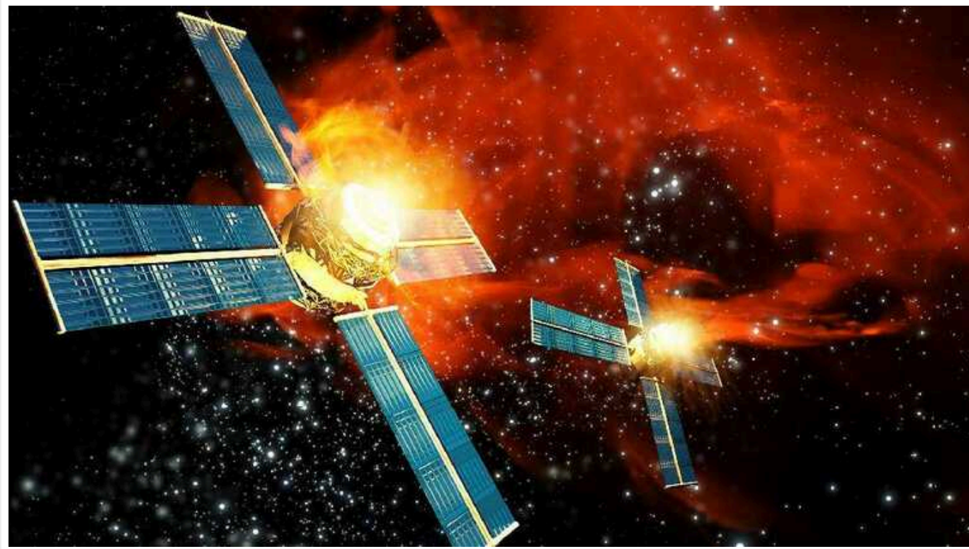
РФ може в 2024 році запустити протисупутникову ядерну зброю до космосу

Росія може запустити протисупутникову ядерну зброю до космосу вже цього року.