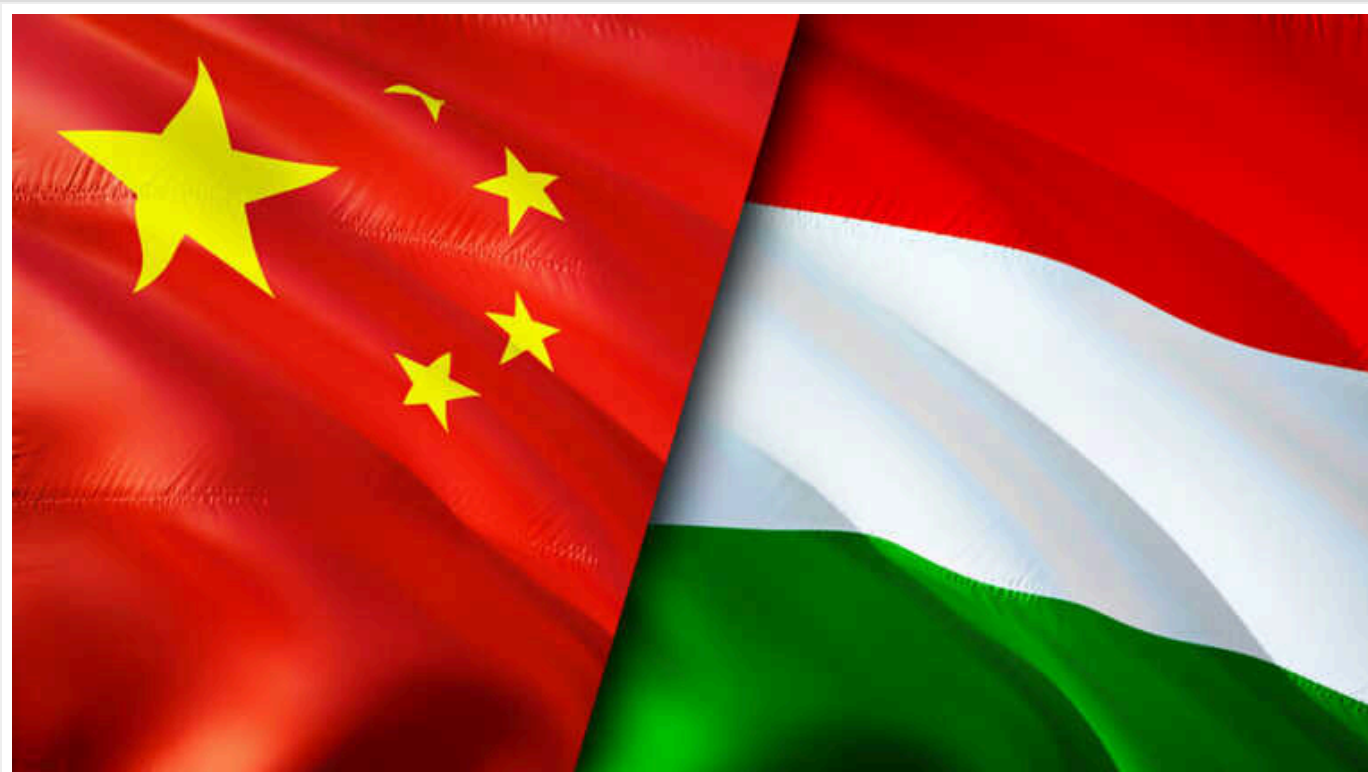
Угорщина та Китай стали недружніми для українців, – соціопитування

Китай та Угорщина перейшли в категорію "скоріше недружніх країн" для громадян України.