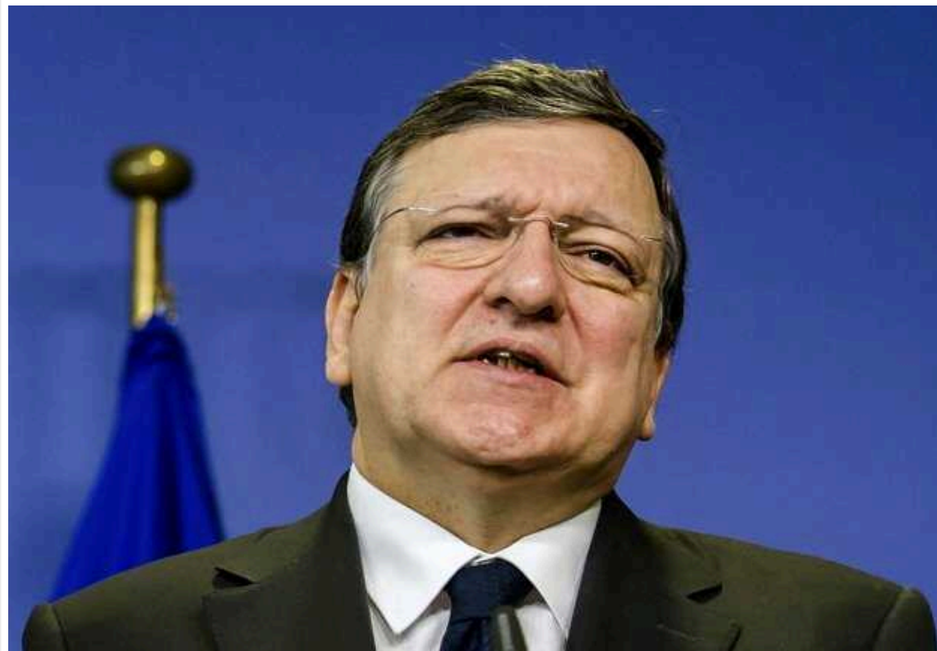
Ексглава Єврокомісії вважає, що Євросоюз не готовий прийняти у свій склад країну у стані війни

Колишній президент Європейської комісії та колишній прем'єр-міністр Португалії Жозе Мануел Баррозу заявив, що Європейський Союз не готовий прийняти країну, що перебуває у стані війни.