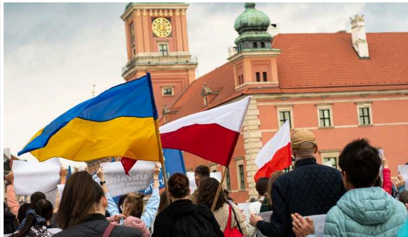
Майже 80% українців сприймають Польщу як дружню країну, але показник суттєво зменшився

Майже 80% українців сприймають Польщу як дружню країну, але цей показник суттєво знизився, порівняно з опитуванням пів року тому, особливо сприйняття Польщі як "однозначно дружньої".