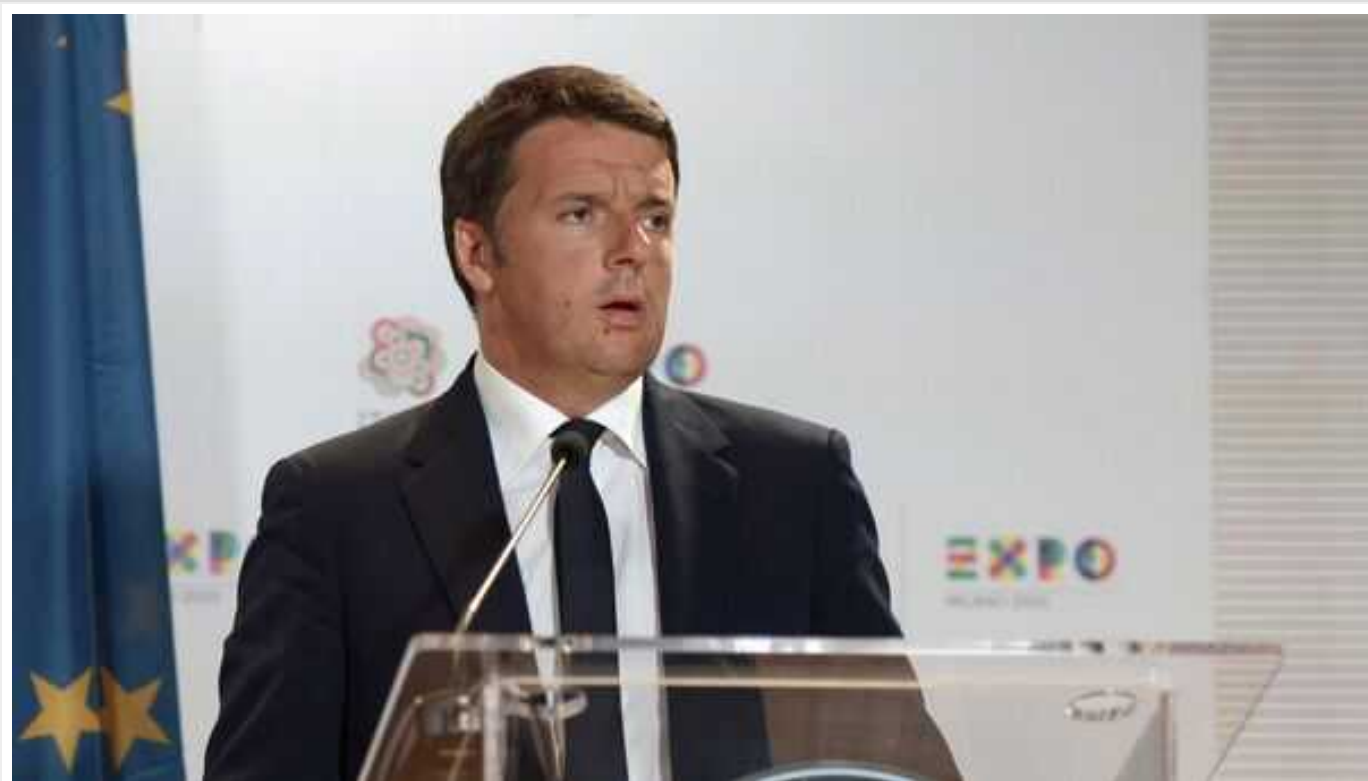
Соратника Мелоні критикують за суперечливі коментарі щодо смерті Навального

Лідер італійської партії "Ліберальна дія" Карло Календа напередодні у соцмережах розкритикував лідера ультраправої партії "Ліга" Маттео Сальвіні, вимагаючи звіту про угоду 2017 року з путінською "Єдиною Росією" і доказів того, що угода між політсилами була скасована.