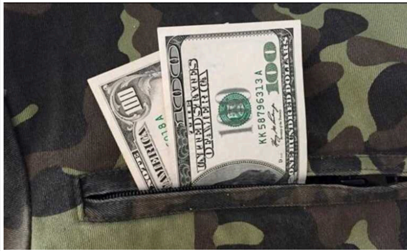
Начальника військ радіаційного та хімічного захисту ЗСУ відсторонили від посади через корупцію

Начальника управління радіаційного, хімічного та біологічного захисту Командування Сил підтримки ЗСУ відсторонили від посади через корупцію.