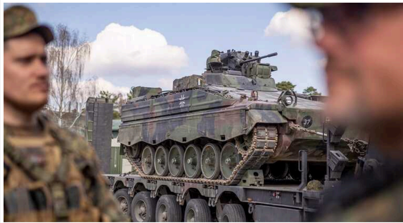
Війна в Україні вже обійшлася Німеччині більш ніж у 200 мільярдів євро

Про це заявив президент Німецького інституту економічних досліджень Марсель Фрацшер газеті Rheinische Post.