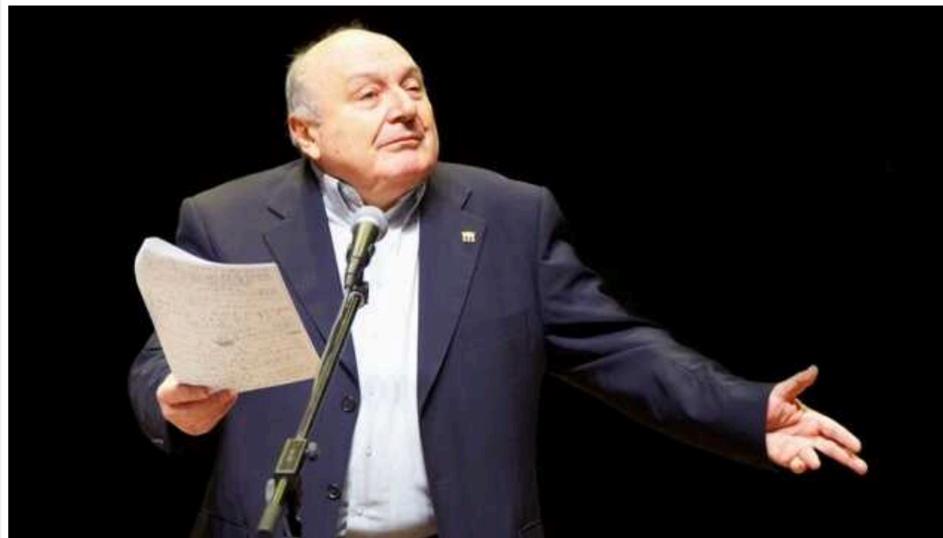
Росіяни збунтувалися проти Жванецького, який ненавидів Росію: вимагають знести його пам'ятник у Ростові

Через тиждень після встановлення пам'ятника письменнику-сатирику Михайлу Жванецькому з Одеси в Ростові-на-Дону російські окупанти висунули вимогу знести його. Монумент не догодив Z-патріотам, які вважають померлого в 2020-му українця "русифобом" і звинувачують його в бажанні "зрівняти Росію з землею".