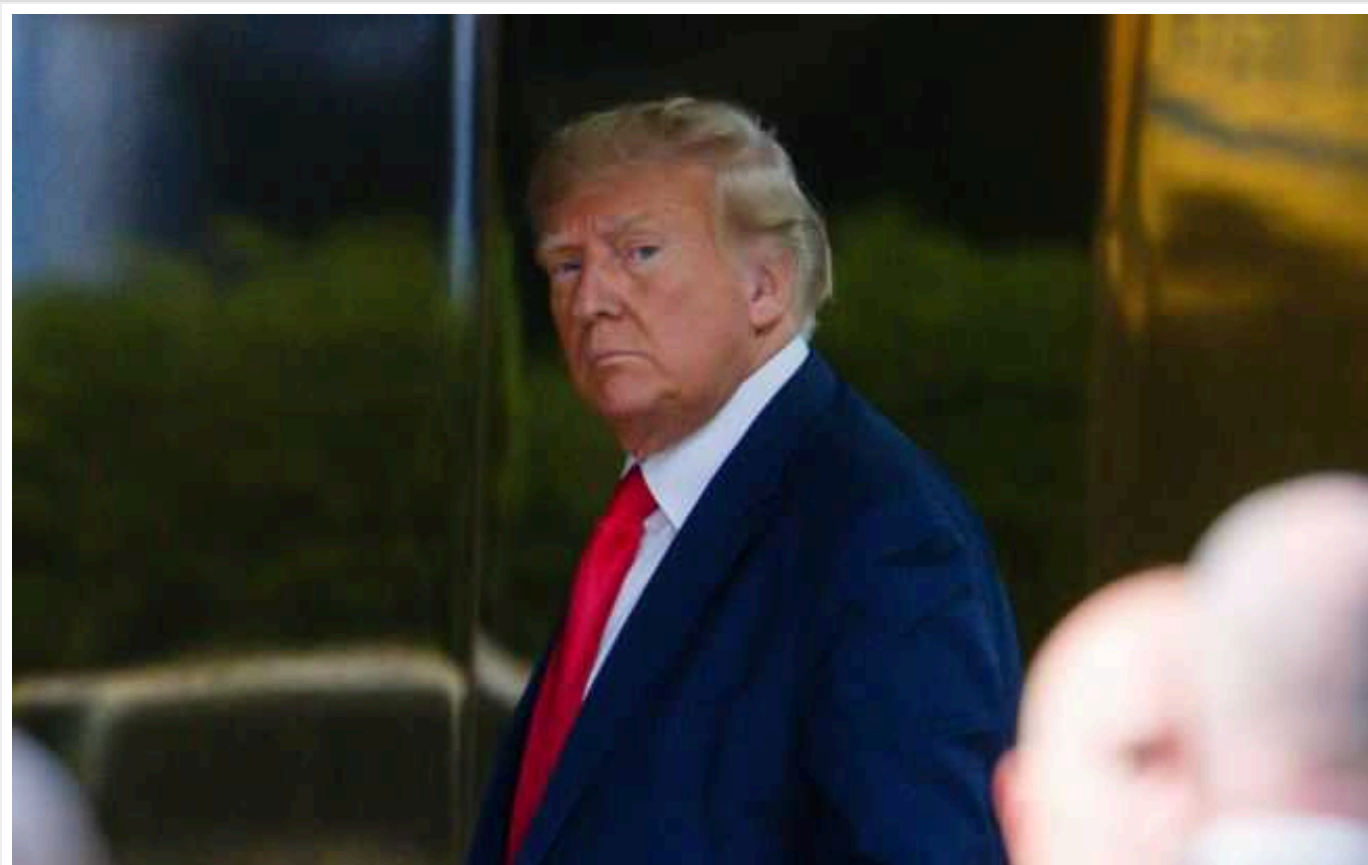
FT: Кількість донорів Трампа скоротилася на 200 тисяч порівняно з 2019 роком

Колишній президент США Дональд Трамп вступив у передвиборчий 2024 рік, маючи на 200 тисяч донорів менше, ніж під час попередньої президентської кампанії чотири роки тому.