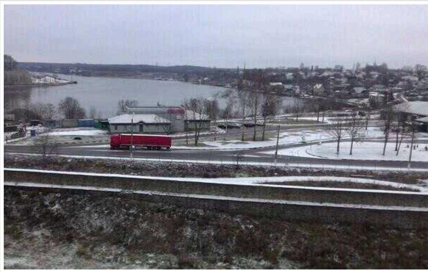
Естонія під час виборів у РФ не планує закривати кордон с Росією

Уряд Естонії не планує закривати прикордонні пункти на кордоні з Росією під час президентських "виборів" у РФ 17 березня.