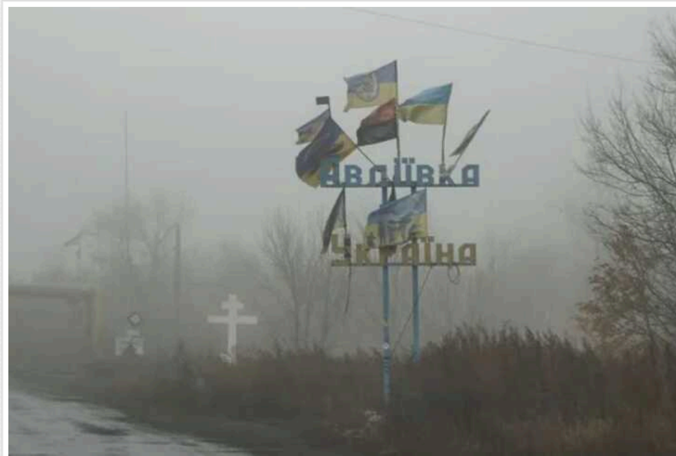
У Пентагоні прокоментували відхід українських сил із Авдіївки: "Зараз на фронті йде критична боротьба"

Представники Пентагону прокоментували відведення українських сил із Авдіївки, називаючи його "стратегічним" кроком, який спрямований на збереження власної артилерії та снарядів. Зараз українські військові ведуть важливу боротьбу за життя і майбутнє країни, тому необхідне негайне фінансування.