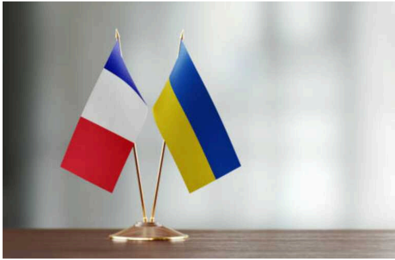
Bloomberg: Франція шукає кошти для фінансування допомоги Україні після масштабного скорочення витрат країни

Французький уряд намагається знайти кошти для фінансування пакета військової допомоги Україні на суму 3 мільярди євро після масштабного скорочення витрат.