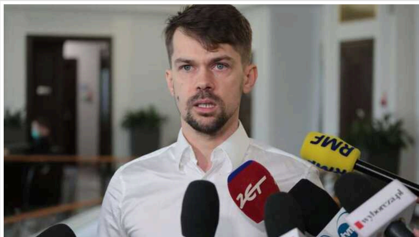
Або Україна з нами домовляється, або будуть нові обмеження на імпорт, – заступник міністра сільського господарства Польщі Колодзейчак

Заступник міністра сільського господарства Польщі Міхал Колодзейчак не виключив подальших обмежень українського імпорту.