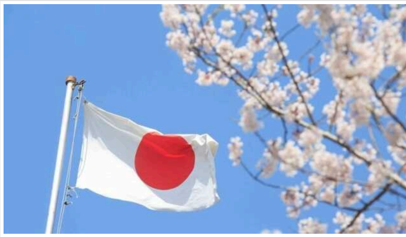
Японія спростила візові вимоги для короткострокового перебування українців

Уряд Японії дозволив видачу багаторазових віз із терміном дії 5 років та періодом перебування в країні до 90 днів для кожного візиту українським бізнесменам і родичам біженців від війни в Україні.