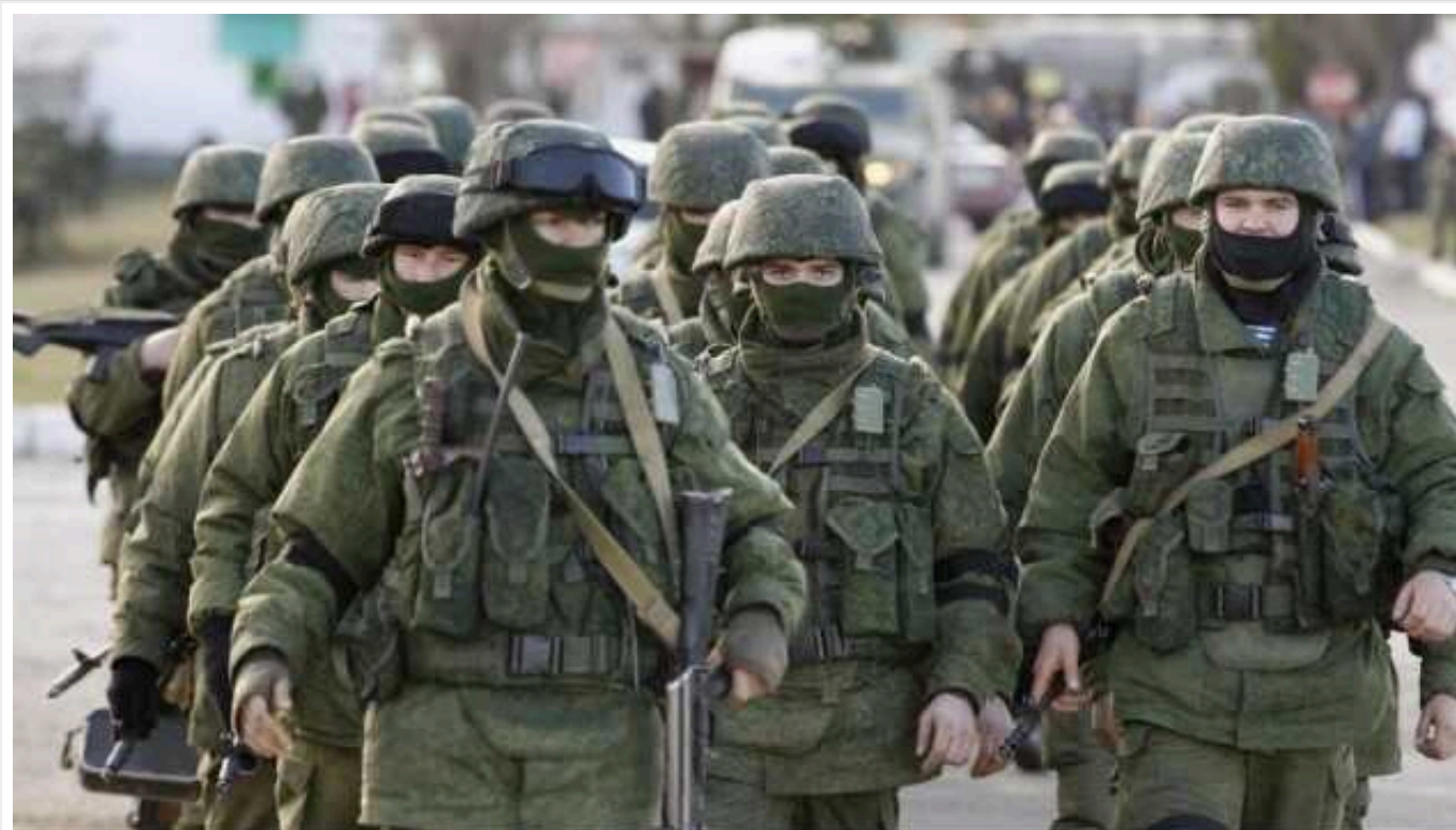
У ЗСУ відреагували на заяві ЗМІ про чисельність окупантів на Запорізькому напрямку

Російські окупанти нібито зосередили на Запорізькому напрямку близько 50 тисяч солдатів. Але вони не становлять такої загрози, як в Авдіївці.