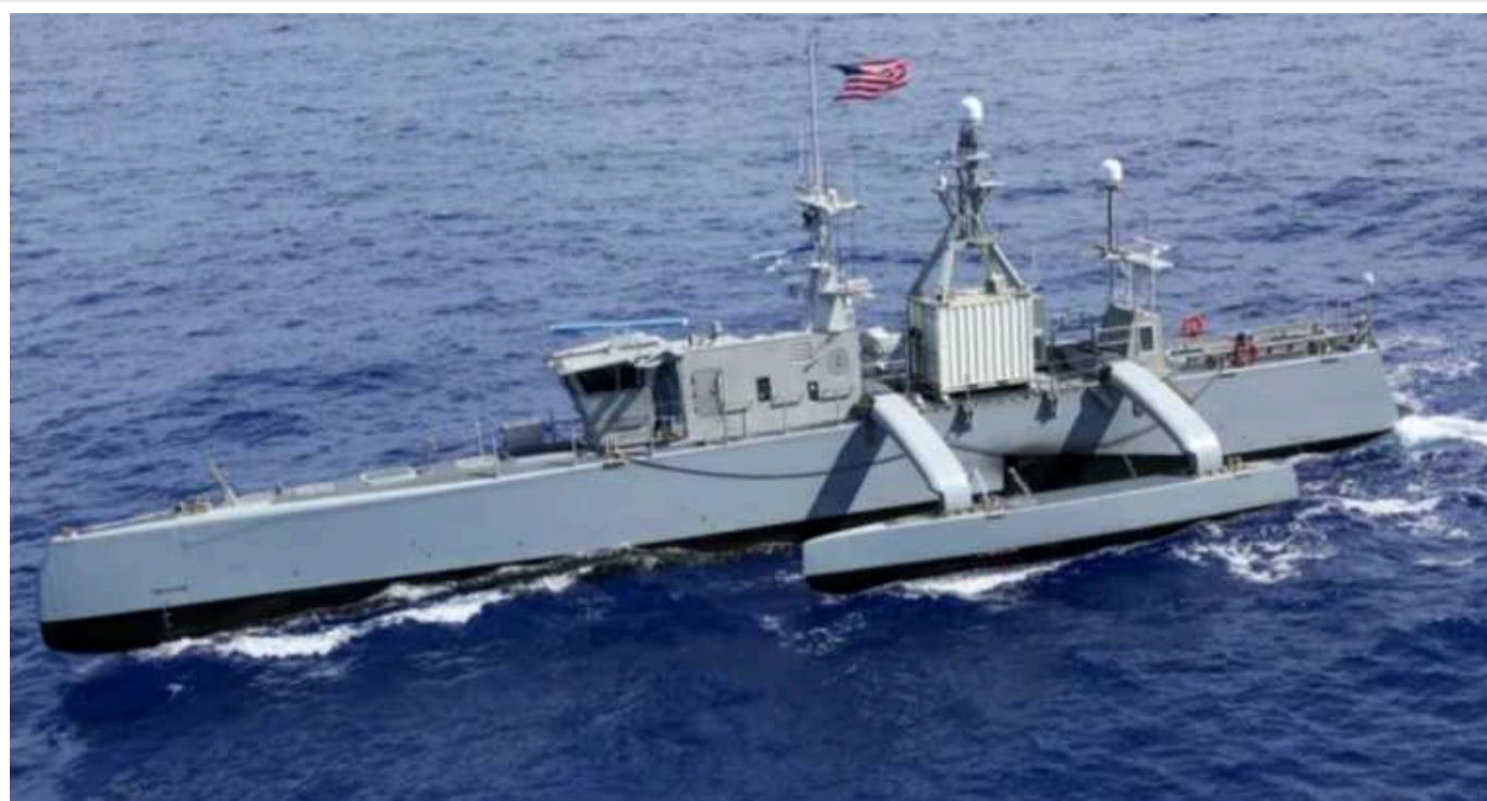
Сполучені Штати розробляють нову військову стратегію

ВМС США прагнуть не допустити ескалації конфлікту на Тайвані, а тому поспішають з розробкою нових безпілотників.