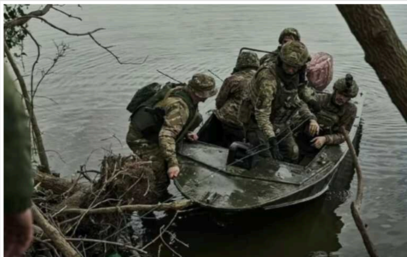
В ISW пояснили, для чого Шойгу збрехав про захоплення Кринків у Херсонській області

Фахівці Інституту вивчення війни (ISW) припускають, що заяви про захоплення плацдарму на лівобережжі Херсонщини потрібні Кремлю, аби посилити бажаний інформаційний ефект напередодні президентських виборів.