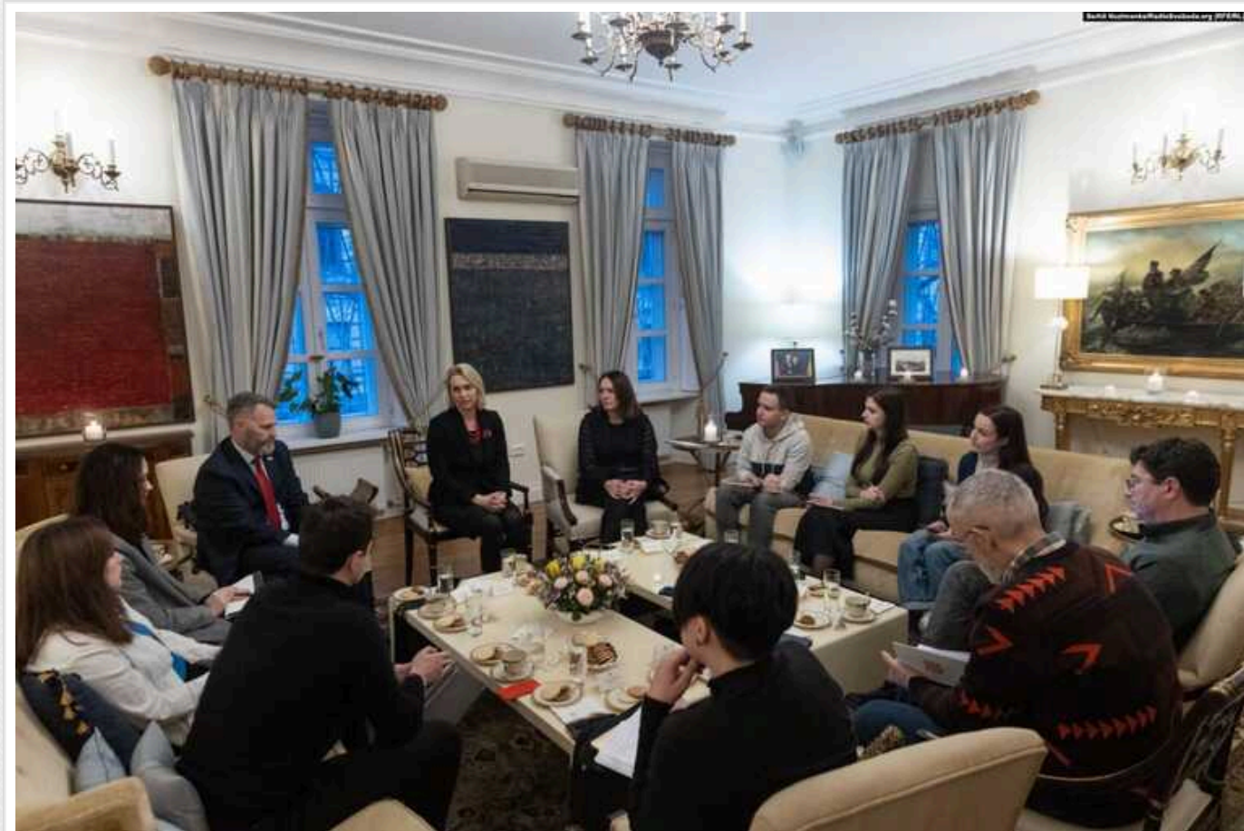
Немає точних термінів для угоди про гарантії та допомогу Конгресу, – посол США в Україні

Посол США в Україні Бріджит Брінк не знає термінів підписання угоди про гарантії між Вашингтоном та Києвом та термінів розблокування допомоги Україні в Конгресі.