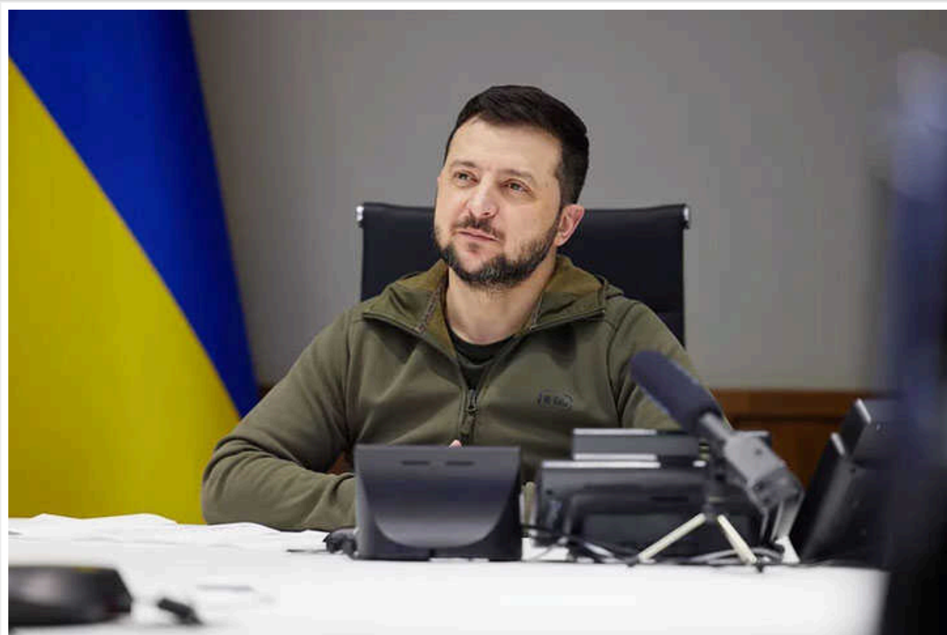
Усе менше українців хоче, щоб Зеленський балотувався на другий термін – опитування

Згідно з соціологічним опитуванням, все більше українців не хоче, щоб президент України Володимир Зеленський балотувався на другий термін. Лише за січень кількість таких громадян побільшала на 9%.