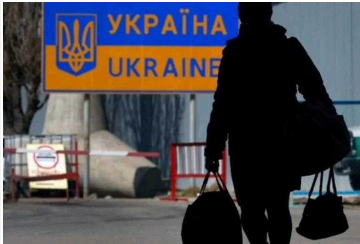
Forbes: 20 мільйонів українців можуть мігрувати, якщо РФ переможе в Україні

Видання пише, що якщо Путін заховає Україну, він нападе на країни Балтії - якби для захисту російськомовного населення, а потім на Польщу.