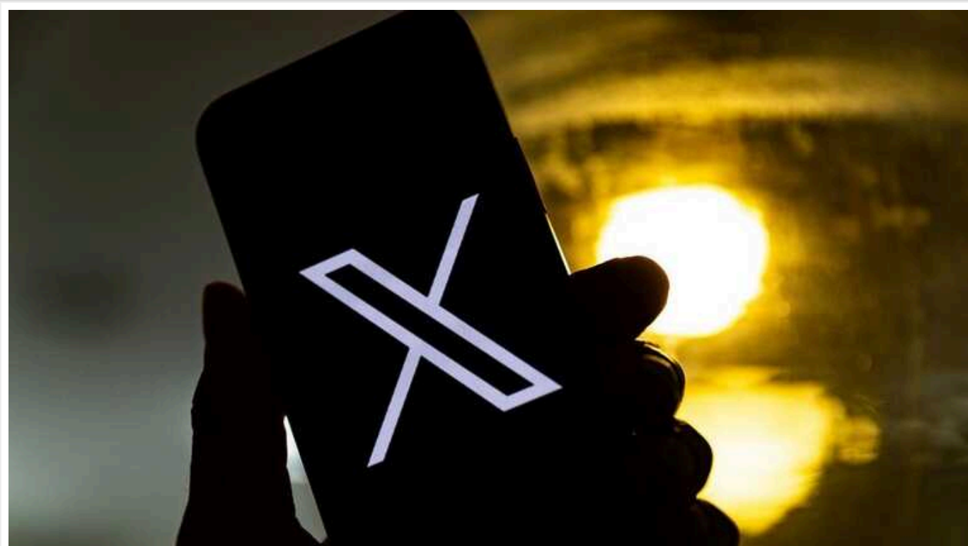
У Х прокоментували блокування облікового запису Юлії Навальної: викликано помилкою алгоритму

Соцмережа Х повідомила, що блокування облікового запису Юлії Навальної було викликано помилкою в алгоритмах.