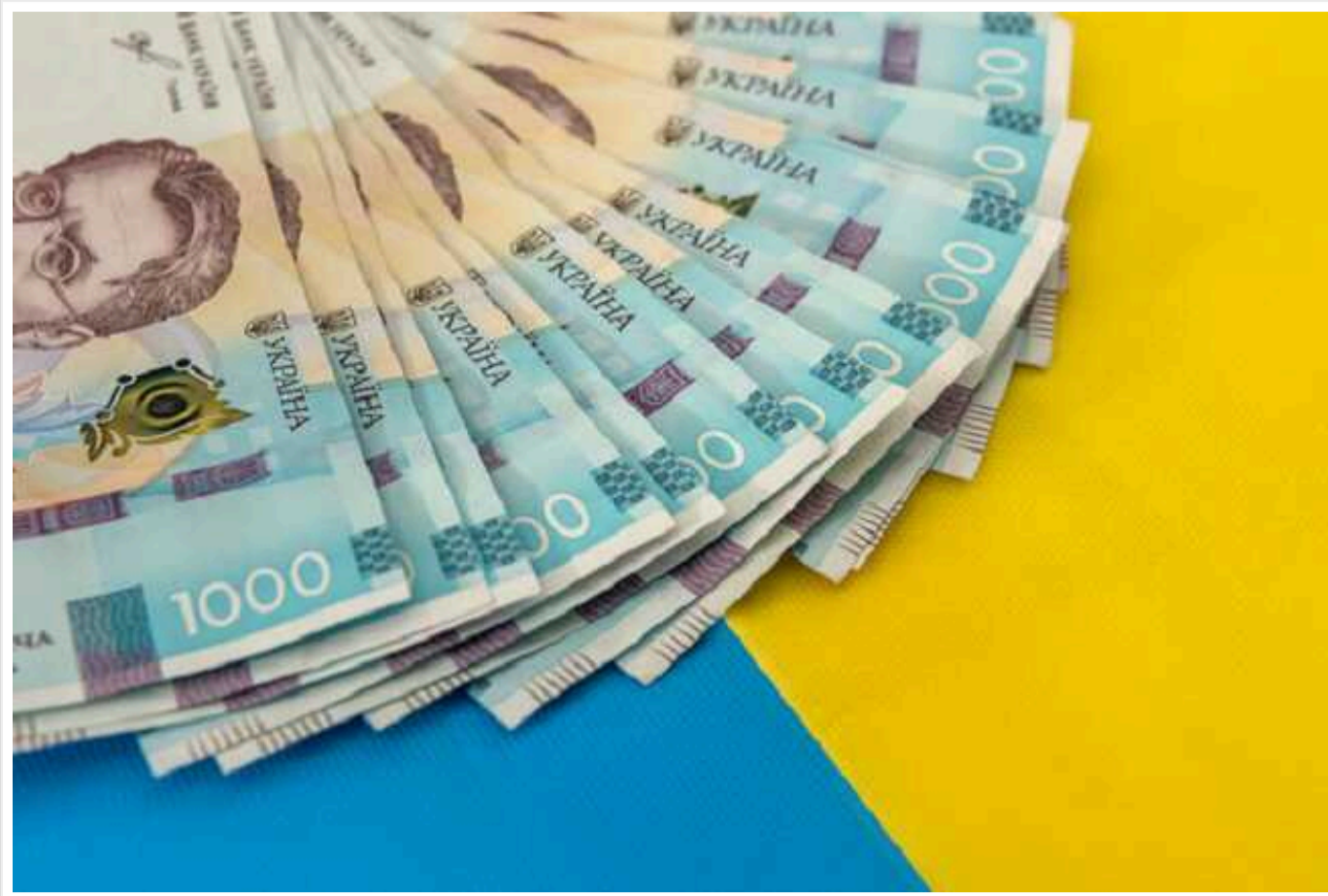
Гривня встановила новий рекорд девальвації

20 лютого міжбанківський валютний курс на торгах Vlootberg піднявся з 38,36 грн/$ до 38,6 грн/$, а закінчилися торги на 38,59 грн/$.