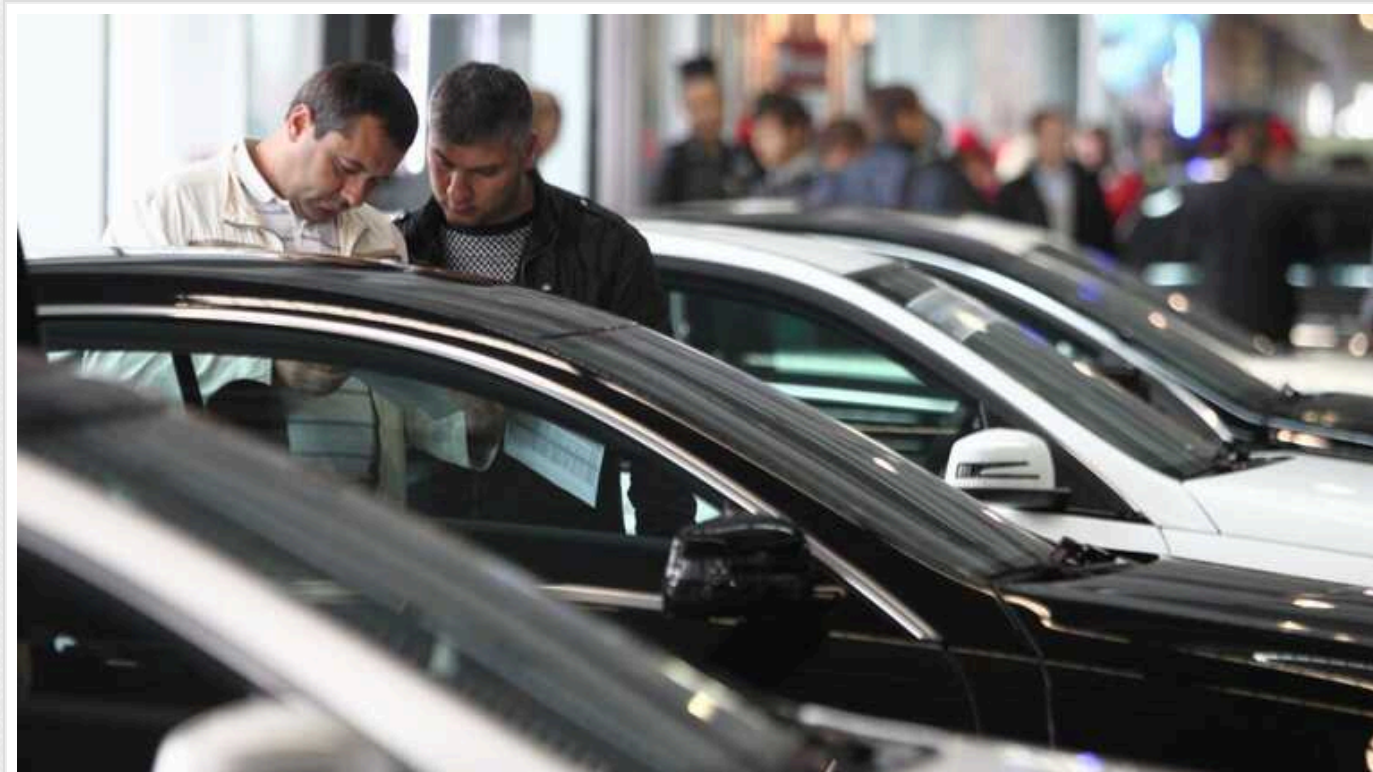
В Україні для власників автомобілів запровадять новий податок

В Україні власників транспортних засобів можуть оподаткувати новим 10-відсотковим податком.