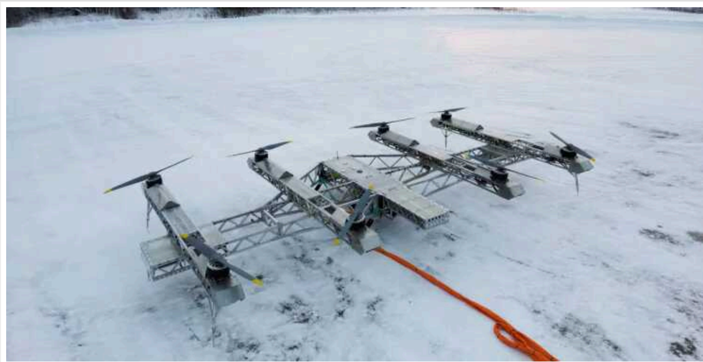
Окупанти створили гігантський мегакоптер, який піднімає 300 кг: «Скоро скидатимемо ФАБи»

Як стверджують росіяни, величезний безпілотник зможе пересуватися повітрям на 500 км і матиме переваги як літака, так і коптера. Безпілотник не потребуватиме аеродромів та інфраструктури.