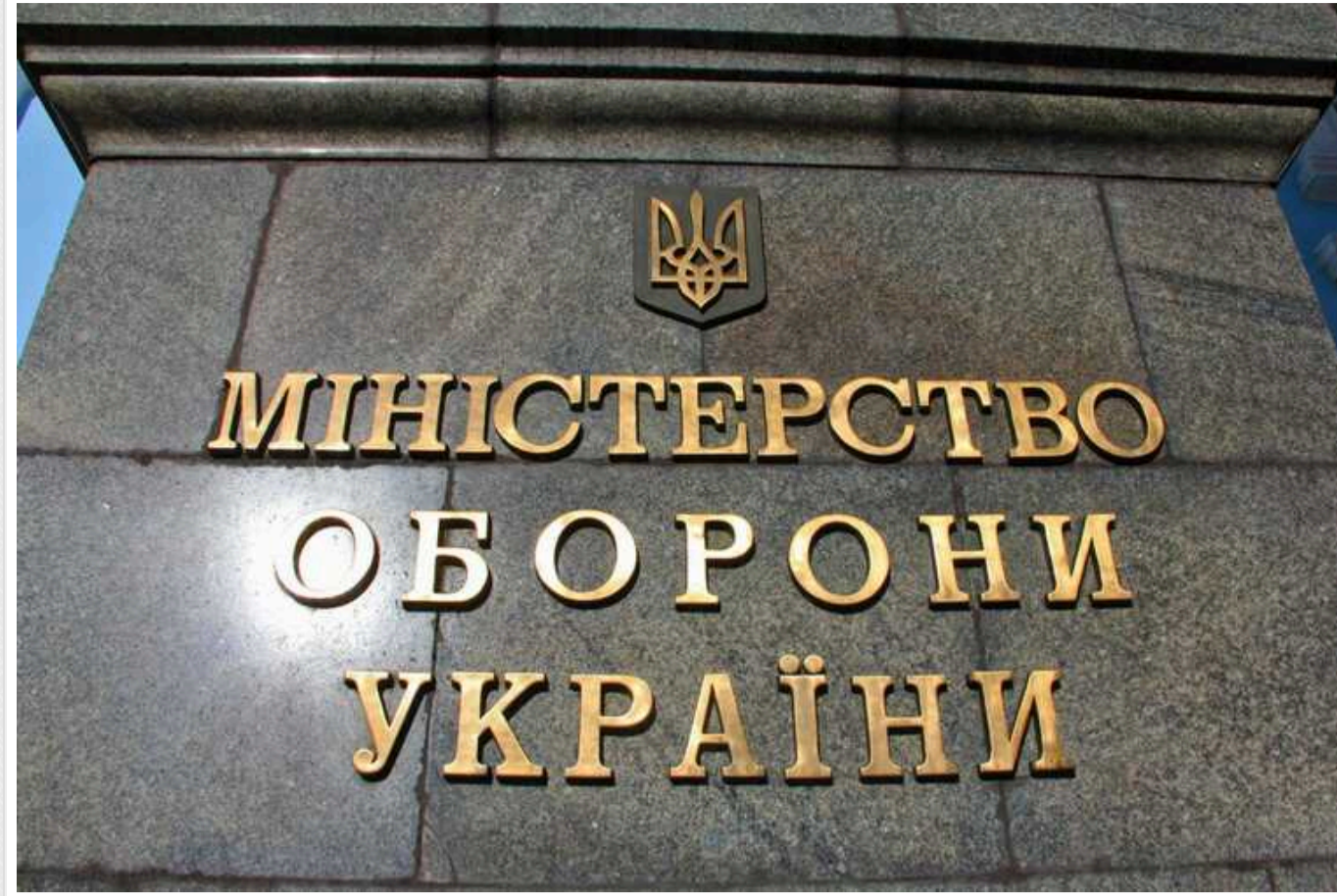
МОУ закупало у чеської компанії гвинтівки та відновлені патрони для ЗСУ за завищеними цінами

МОУ закупило у чеської компанії AKM Group-CZ 500 снайперських гвинтівок у 3 рази дорожче від реальної ціни та «відновлені» НЕ бронебійні патрони, а правоохоронці заарештували на рахунку чеської компанії 39 мільйонів доларів українських коштів.