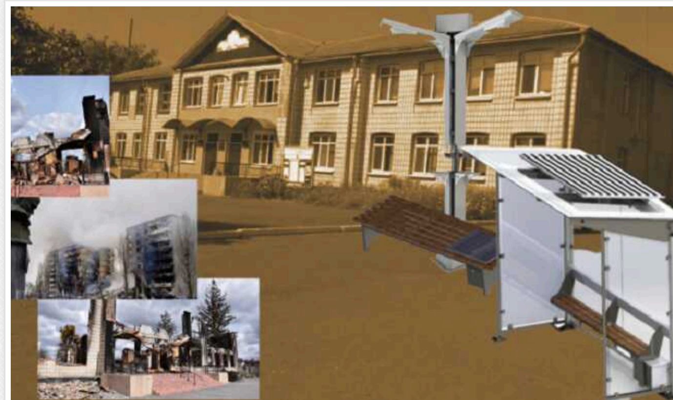
Бородянський реабілітаційний центр витратив 2,3 мільйона гривень на зупинки, лавки та стовпи з сонячними панелями

Бородянський центр соціально-психологічної реабілітації, будівля якого практично з нуля відновлюють після прямого танкового влучання, здійснив кілька неординарних закупівель. Заклад замовив двадцять лавок та три зупинки громадського транспорту, обладнаних сонячними панелями та USB-роз'ємами.