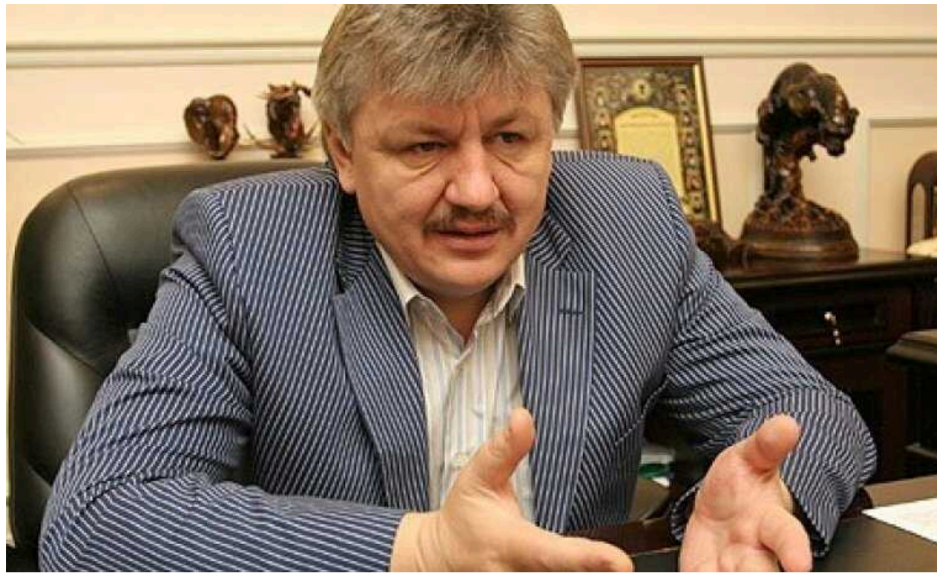
Сівковичу висунули підозру у держзраді

Повідомлено про нову підозру колишньому заступнику секретаря Ради національної безпеки та оборони України Володимир Сівковичу у вчиненні державної зради (ч. 1 ст. 111 КК). Про це повідомляє Офіс Генпрокурора.