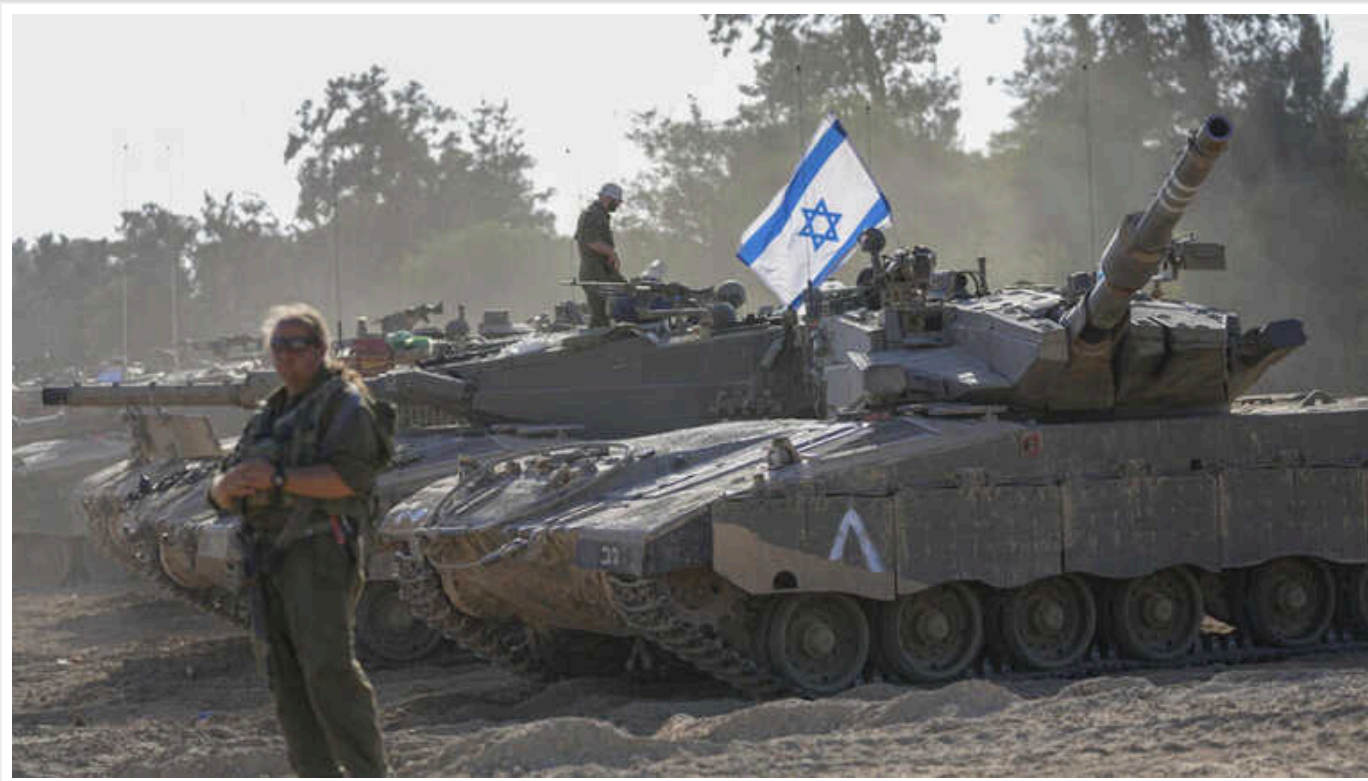
ЦАХАЛ завдав потужних авіаударів по території Лівану: знищено склад зброї "Хезболли"

У понеділок, 19 лютого Повітряні сили Ізраїлю завдали ударів по об'єктах ісламістської організації "Хезболла" в районі Марвахіна на півдні Лівану. Було уражено склад зброї, там лунали потужні вибухи.