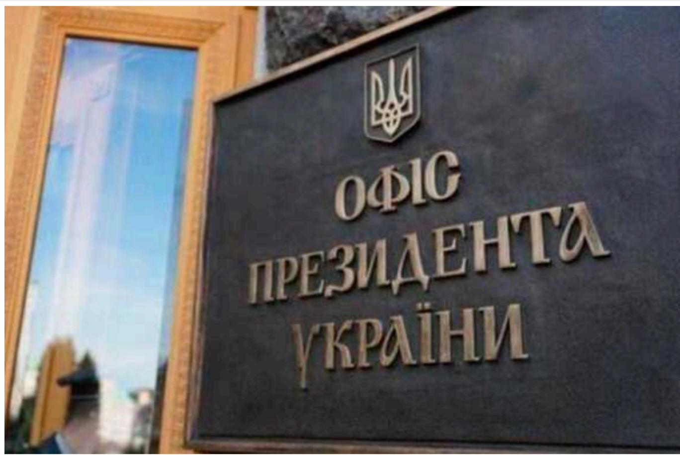
В ОП пояснили безпекові угоди з Німеччиною і Францією

Обсяг конкретної допомоги Україні від Франції та Німеччини передбачають безпекові угоди з цими країнами. А Збройні сили України повинні стати однією з найсильніших армій Європи, щоб гарантувати безпеку країн-партнерів.