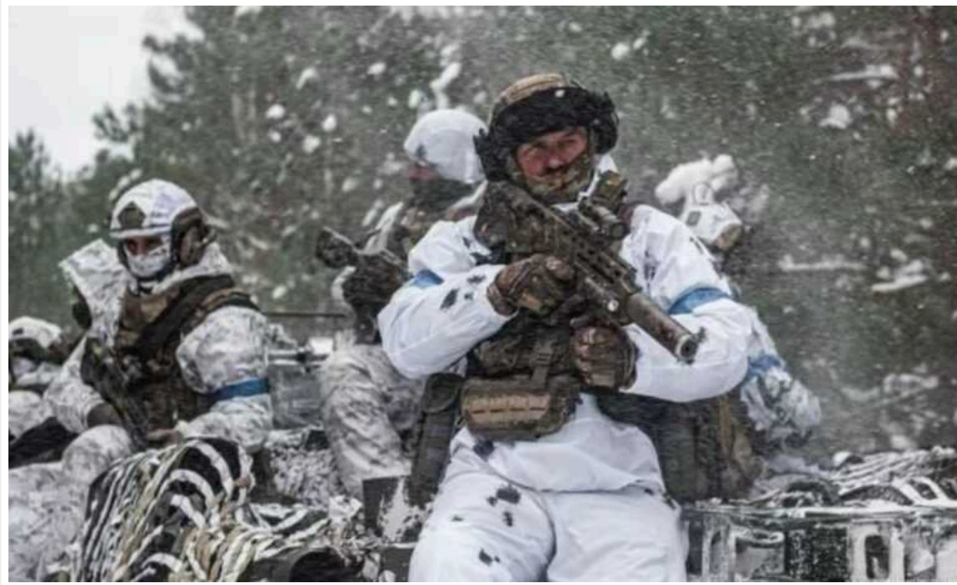
Втрати ворога: за добу ЗСУ ліквідували понад 1000 окупантів і 40 артилерійських систем

За минулу добу Сили оборони ліквідували 1230 окупантів, а також їхні 36 ББМ, 40 артилерійських систем та 2 літаки.