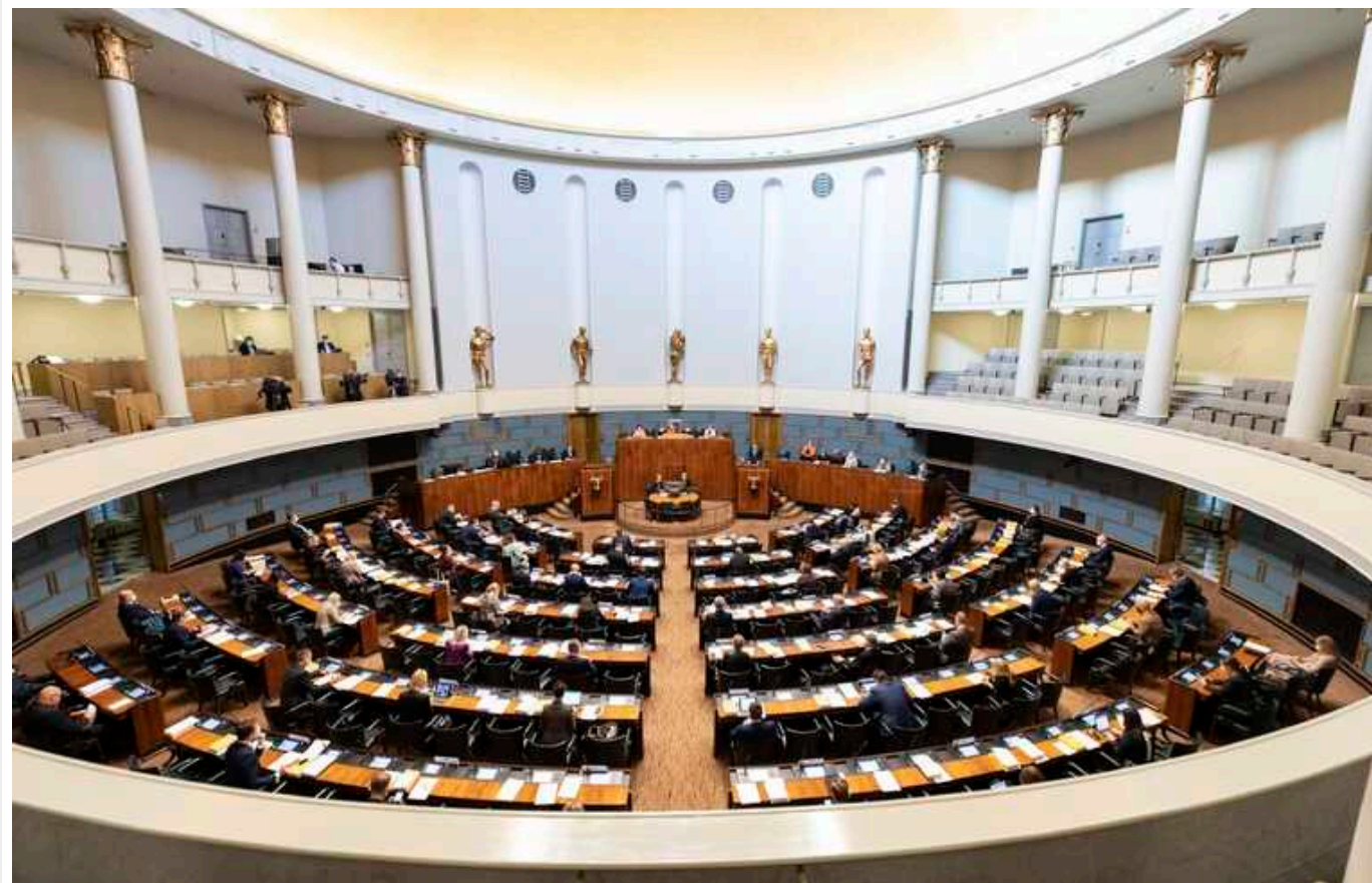
Депутатів фінського парламенту розділило питання транзиту ядерної зброї через територію країни

Частина депутатів парламенту Фінляндії проти транспортування ядерної зброї через територію країни, інші підтримують це.