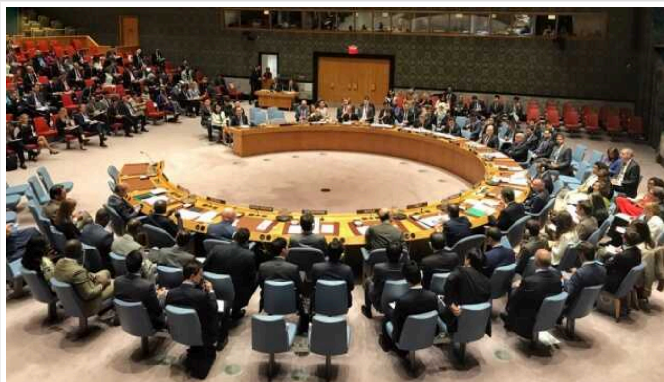
Радбез ООН та Генасамблея планують заходи до річниці повномасштабного вторгнення Росії в Україну

Генасамблея і Радбез ООН проведуть заходи з обговорення ситуації в Україні з приводу другої річниці повномасштабного російського вторгнення.