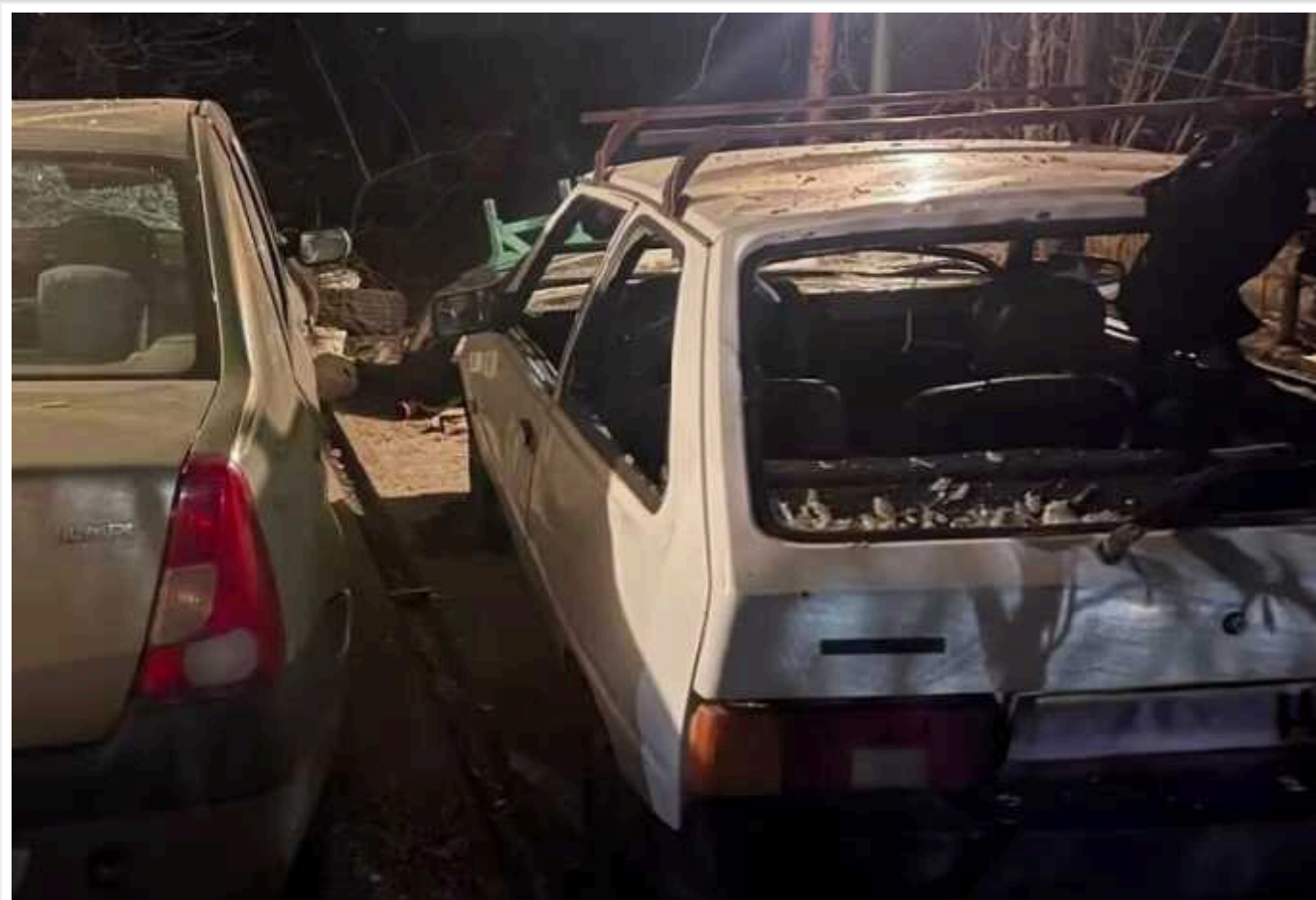
На Дніпропетровщині уламки збитих "Шахедів" пошкодили 3 будинки і 2 авто

Уламки збитого російського "Шахеда" пошкодили 3 дачні будинки та 2 автомобілі у Дніпровському районі Дніпропетровської області.