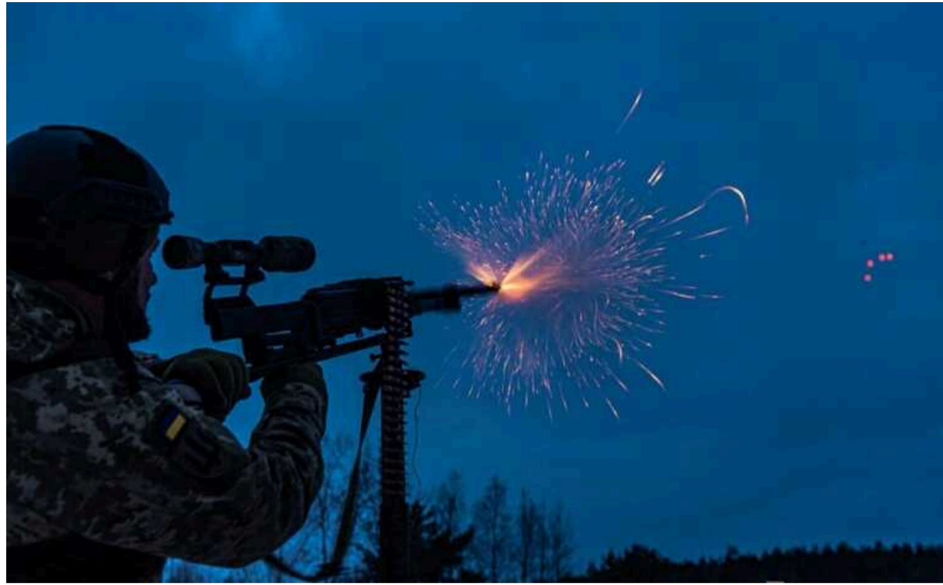
Сили ППО збили усі 23 БпЛА, якими РФ атакувала Україну

У ніч на 20 лютого росіяни атакували Україну 3 ракетами та 23 ударними безпілотниками типу "Shahed", усі ворожі дрони вдалося знищити.