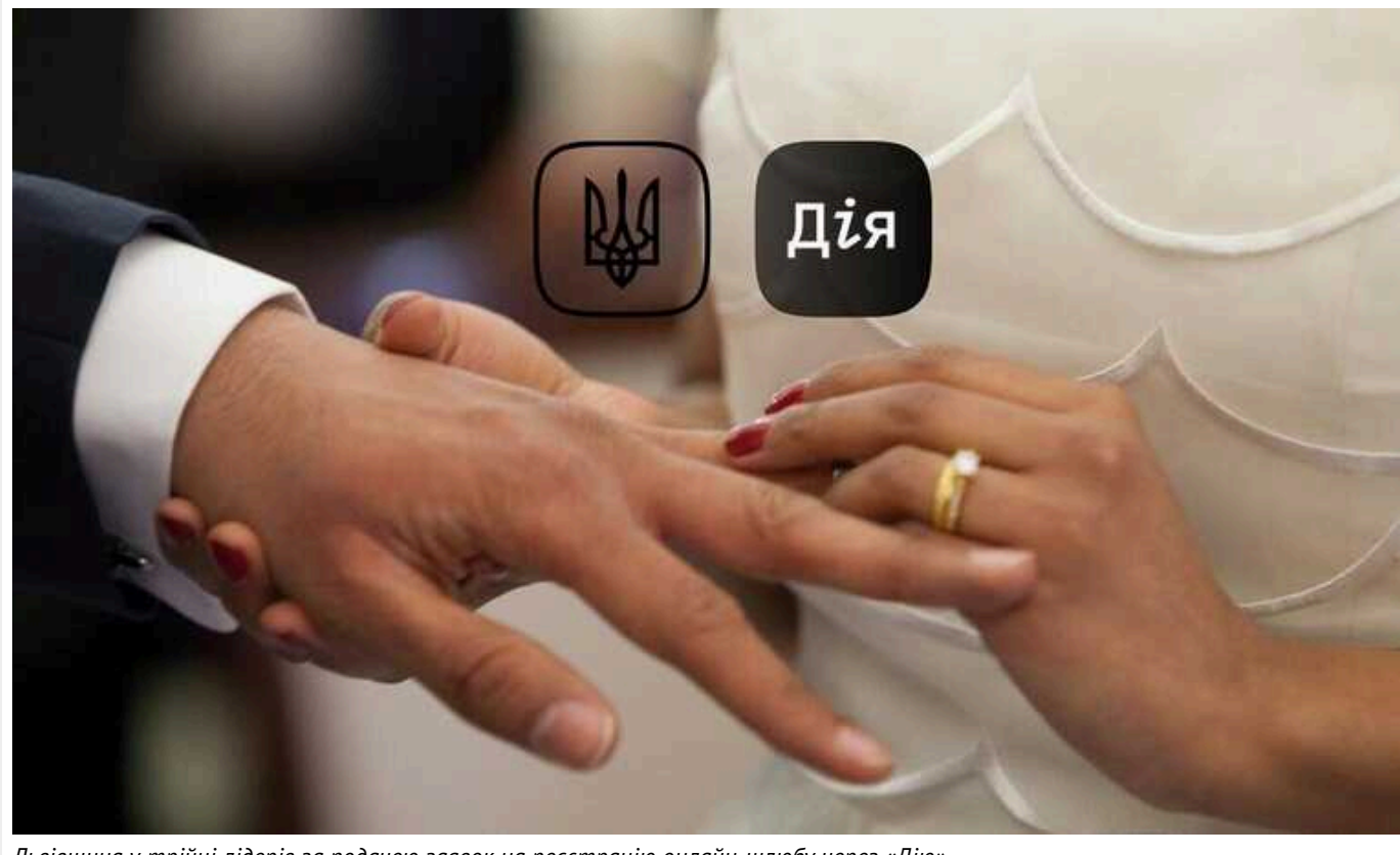
Львівщина у трійці лідерів за подачею заявок на реєстрацію онлайн-шлюбу через «Дію»

Майже 20 тисяч пар подали заявки на реєстрацію шлюбу через портал «Дія». Найбільше онлайн-заяв подали мешканці Києва, Львівської та Одеської областей.