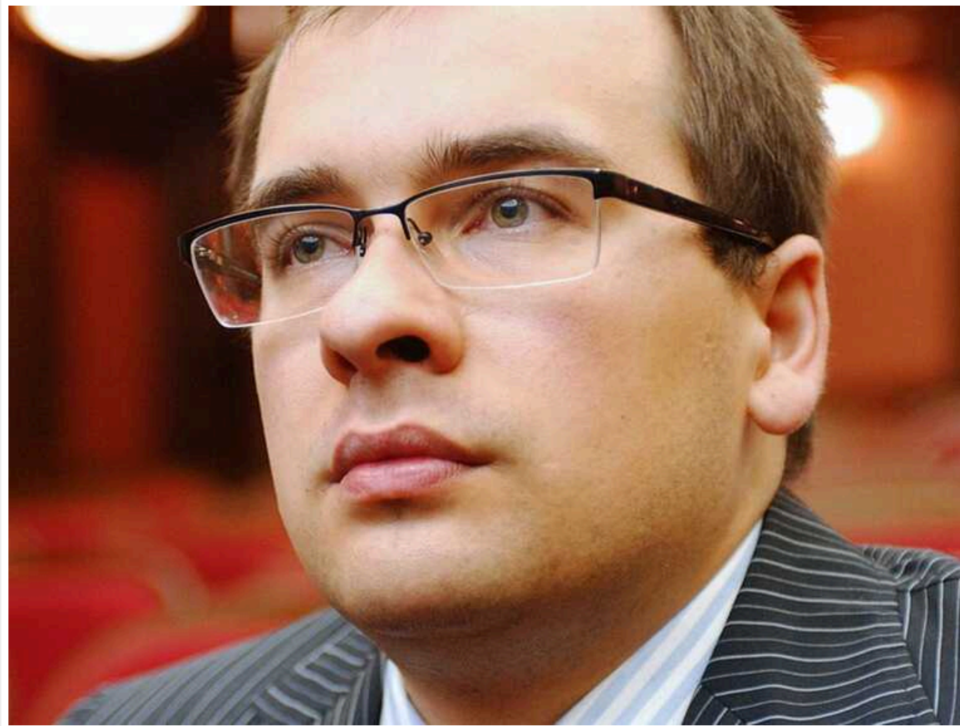
«Відірвався тромб»: з'явилися подробиці раптової смерті сина найближчого соратника Путіна

Син глави Роснафти Ігоря Сечина Іван помер в особняку на Смарагдовій вулиці у котеджному селищі «Європа-1» (СНТ «Зелений вітер») у Красногорську. "Швидку" викликала охорона, проте назвала неточну адресу. В результаті медики їхали майже дві години, і на той час чоловік помер.