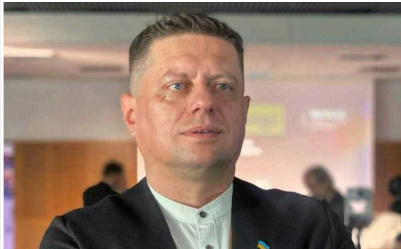
Генпрокурор закрив справу звинуваченого у розкраданні гуманітарки ексчиновника Львівської ОДА