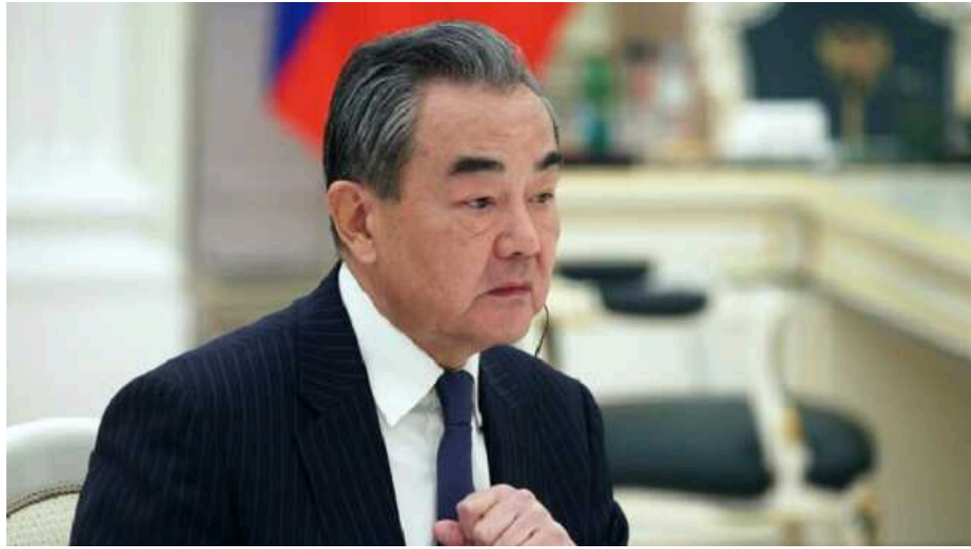
КНР не продає зброю жодній із воюючих сторін, - CNN

Видання CNN пише, що Китай заявив Україні, що не продає зброю жодній із воюючих сторін.