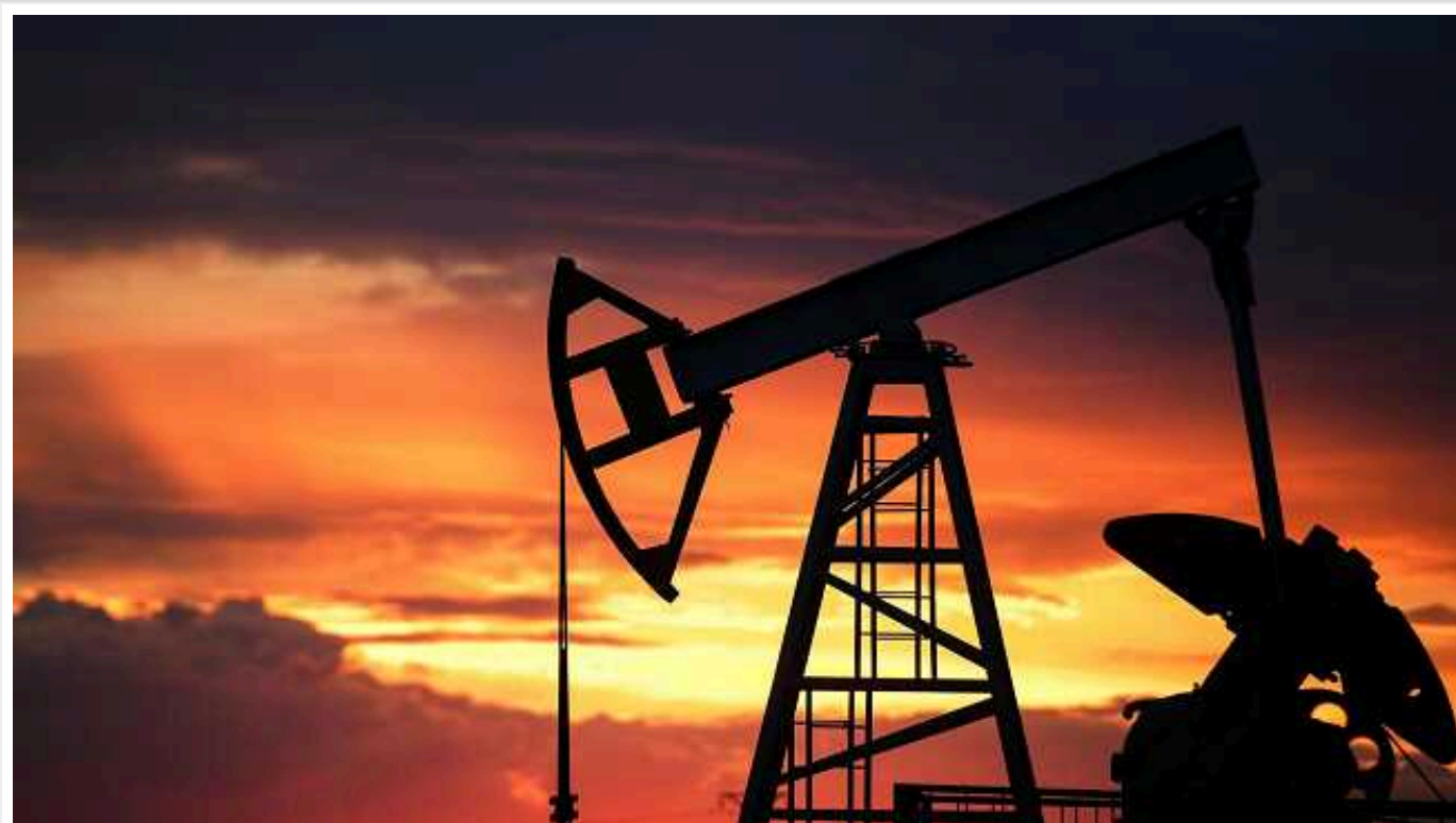
РФ має безпрецедентну суму грошей у держскарбниці: цьому сприяють рекордні продажі сирої нафти до Індії на 37 мільярдів доларів

CNN повідомляє, що РФ має безпрецедентну суму грошей у державній скарбниці, чому сприяють рекордні продажі сирої нафти до Індії минулого року на рекордні 37 млрд доларів, збільшивши їх за рік у 13 разів.