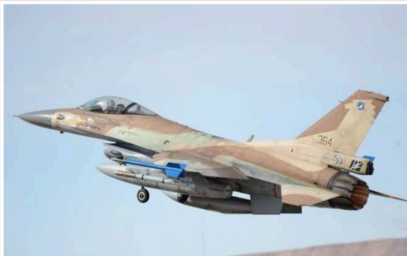
США підготували проєкт резолюції для Радбезу ООН, який закликає до тимчасового припинення вогню у війні в Секторі Газа, - Reuters

Видання Reuters пише, що США підготували проєкт резолюції для Ради безпеки ООН, що закликає до тимчасового припинення вогню у війні в Секторі Газа, і висловлюють свою незгоду з ізраїльською операцією в Рафасі, яка може призвести до численних жертв серед цивільного населення та створити загрозу регіональному світу та безпеки.