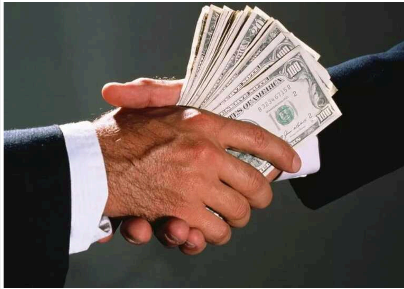
Експосадовців «Укрзалізниці», засуджених за корупцію, звільнили на умовний строк

Апеляційна палата Вищого антикорупційного суду визнала винуватими трьох колишніх посадовців АТ «Укрзалізниця» у зловживанні під час надання пільгових тарифів на вантажоперевезення. Водночас їх звільнили на умовний строк. Про це повідомляє ВАКС.