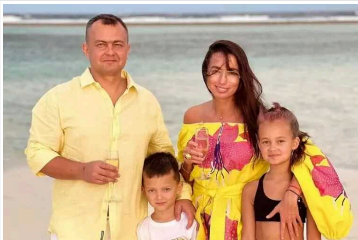
Дружина екснардепа Арістова, якому оголосили підозру, подала на розлучення

Дружина скандального ексдепутата та колишнього заступника голови Комітету Верховної Ради з питань національної безпеки оборони та розвідки Юрія Арістова, який оскардився відпочинком на Мальдівах в липні 2023 року, подала на розлучення. Про це стало відомо після публікації відповідних документів, що свідчать про розлучення пари.