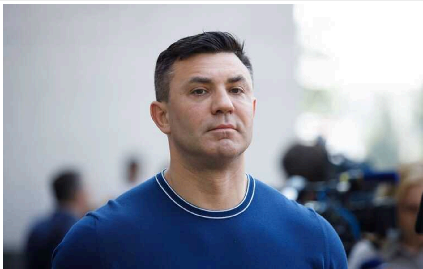
Нардеп Тищенко задекларував 5,6 мільйонів гривень готівкою

Позафракційний депутат Верховної Ради Микола Тищенко (колишній «Слуга народу») задекларував годинники Rolex, авто Mercedes S-класу, 5,6 млн гривень готівкою у 2022 році. Про це йдеться в останній поданій ним декларації.