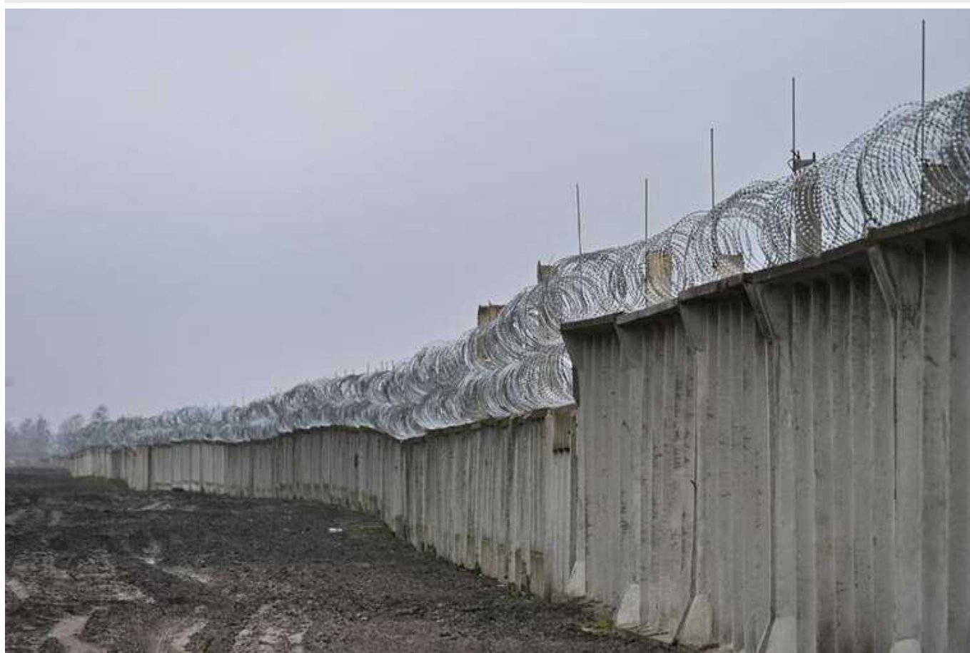
Усі області України зміцнюють кордони та будують фортифікаційні споруди на фронті